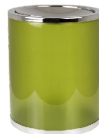
Elite Poliéster 20x23 cm 7,2l