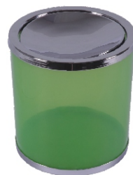
Elite PP 20x20 cm 6,2l