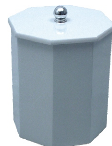
Oitavado 20x26 cm 7,3l