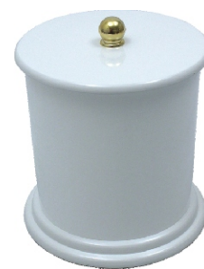
Redondo 24x25 cm 6,2l