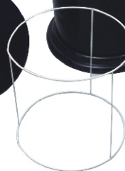
Suporte para Saco de Lixo