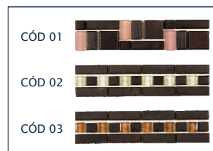
Detalhes em Madeira e Vidro