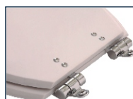
Ferragem Soft Close