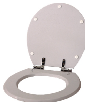
ASSENTO DE FECHAMENTO LENTO

Todas as cores e modelos do mercado nacional.