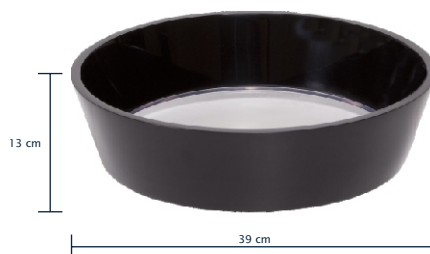
CENTTRO Cuba de Apoio 39x13 cm

Fundo totalmente transparente, possibilita um efeito dinâmico de luz quando há água em movimento.